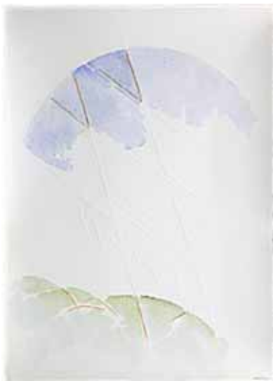
Paolo Gubinelli, acquerello, graffi su carta Artem a mano in Fabriano, cm70x50, 2010

PAOLO GUBINELLI - TONINO GUERRA opere su carta