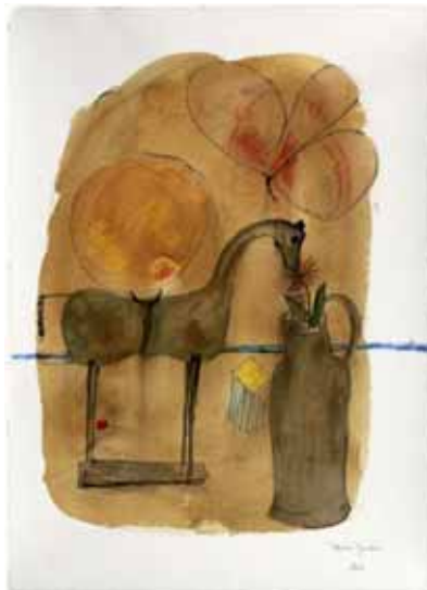
Tonino Guerra, acquerello su carta , Artem a mano in Fabriano, cm70x50, 2010